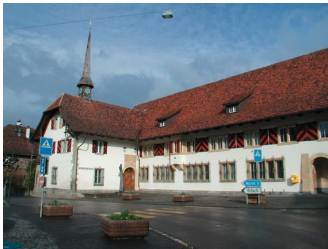
La maison de commune d'Anet (BE).

Pour plus de renseignements sur la solution de La Poste: Hotline: 058 453 51 51 E-mail: info.ewid@post.ch Internet: www.post.ch/ewid